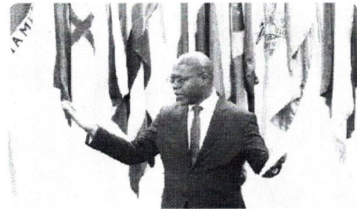
O GRUPO DEVERÁ CONCLUIR OS SEUS TRABALHOS AO FIM DE 180 DIAS